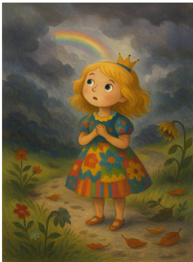
slika: Veselka na poti v težavah, z izzivi in sencami žalosti

Ni več bila tista deklica, ki je mislila, da smeh zdravi vse. Začela je slutiti, da ima vsaka senca svoj namen – da se šele iz nje rodi svetloba