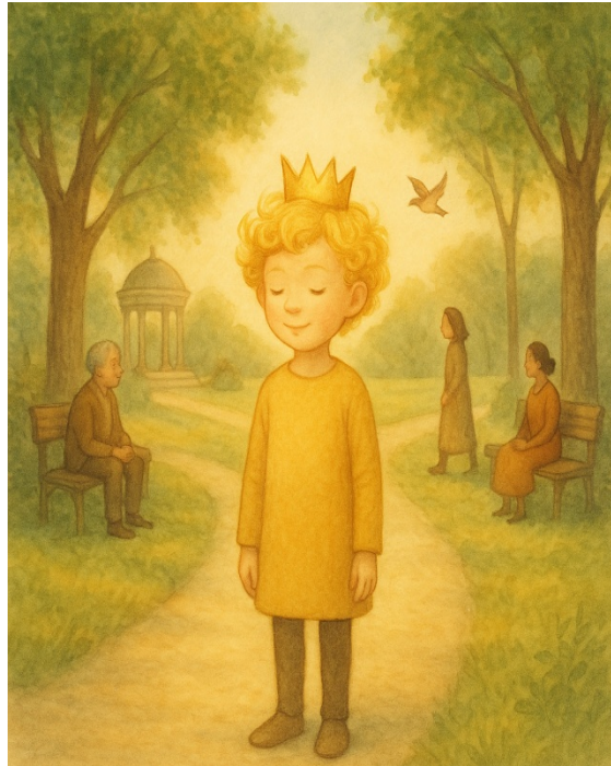
slika Golden Rula

Ko si stal v središču, si imel občutek, da si del celote, ne njen gospodar.