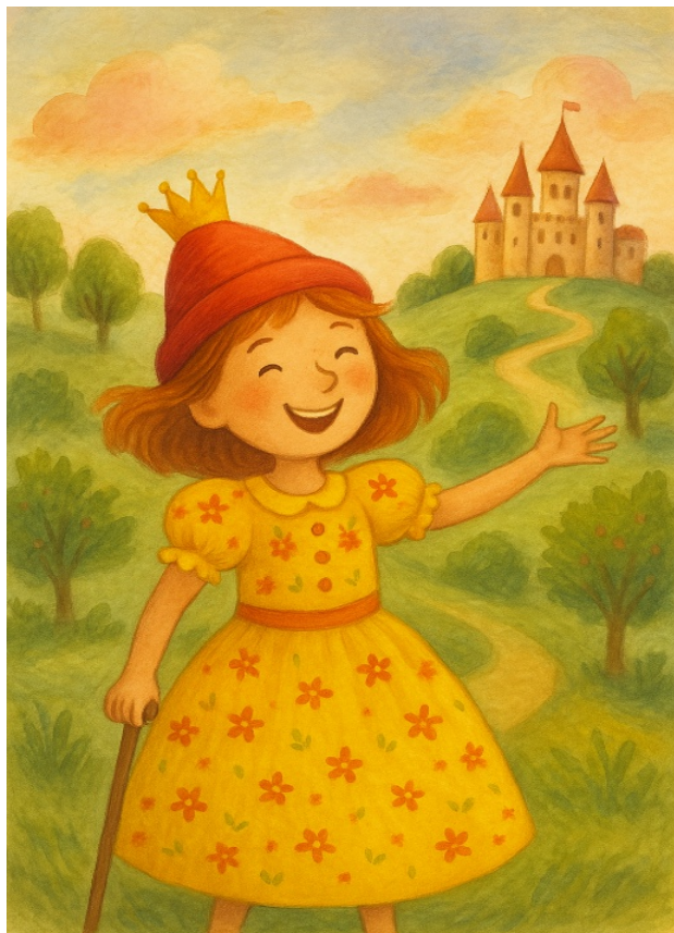
slika: Veselka na poti domov, s svetlobo v očeh in nasmehom v srcu

V njej je bilo nekaj, kar se je dotaknilo vsakega: veselje, ki se ne rodi samo iz sreče, ampak iz vonja prave ljubezni.