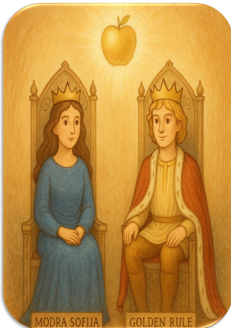
slika: modra Sofija in srčni Golden Rule skupaj na prestolu