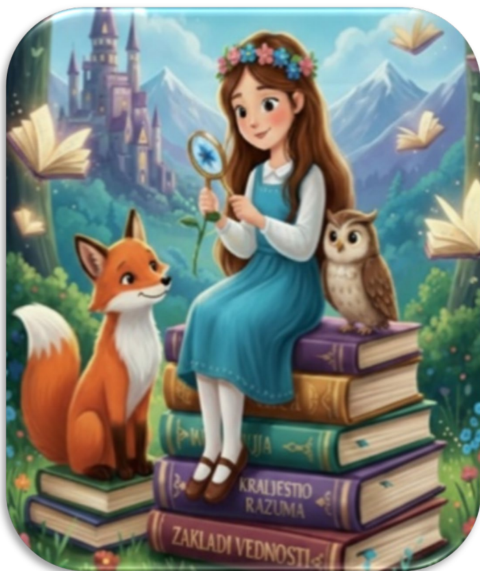
slika: Sofija v svetu znanja

V rajskem kraljestvu je bila Sofija prva kraljeva hči, ki so jo vsi poznali kot »živo enciklopedijo«.