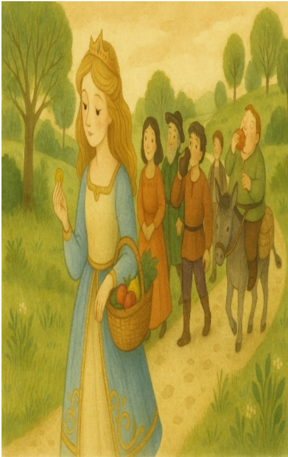
slika Modesta, ki razume, da zmernost brez srca postane hladna.