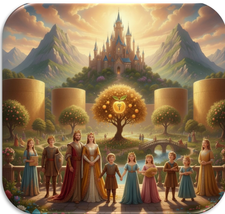
slika KRALJESTVO KOT OAZA

Zgodba nas vodi skozi svet naših želja in sanj, v katerih pa se hitro izgubi vsakdo, ki pozabi na bistveno sporočilo kraljevske naloge. Ta naloga od nas zahteva, da opravimo določene preizkušnje. Zahteva, da odrastemo in prevzamemo odgovornost. Ko si v oazi obilja, je to lahko izjemno težko, še posebej, če pozabiš na svojo pravo identiteto in na razlog, zaradi katerega si sploh prišel na ta svet. Vstopimo torej v to kraljestvo.