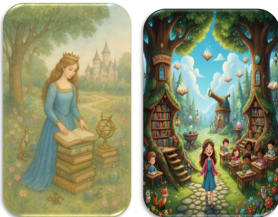
slika: Sofijin dar vedoželjnosti in ljubezni do znanja

Zdelo se je, da je znanost ključ do vseh odgovorov.