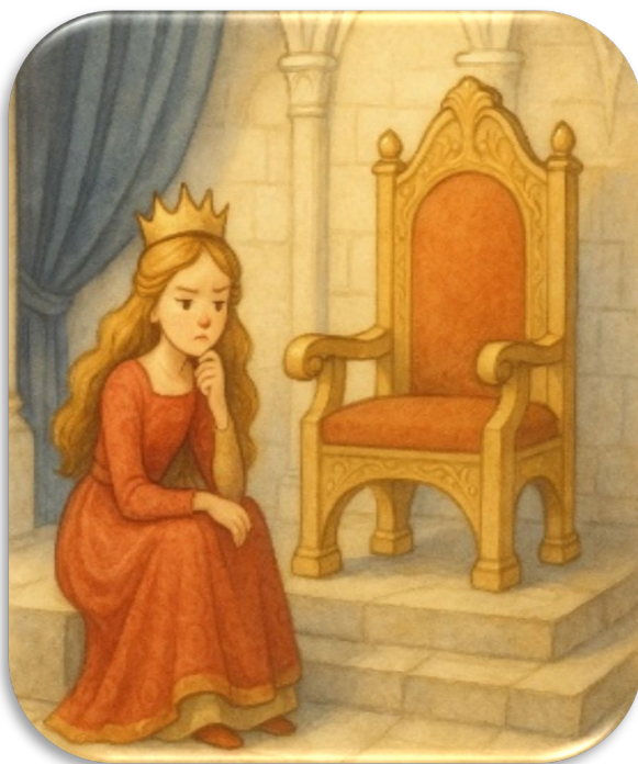
slika Sofija razmišlja o lastnih napakah

Namesto čudenja in radosti je v njenem parku vladala hladna logika, v ljudeh pa se je naselila nemoč in odtujenost. Ko je oče kralj naročil nalogo o zlatem jabolku, je Sofija šla na pot samozavestno – s knjigami, načrti in zemljevidi. A tam, v puščavski oazi, se je ujela v prerekanje: kdo bo prvi prišel do vode. Njena prevzetnost jo je slepila in pozabila je na bistvo – da naloga ni dokazovati le sebe, temveč služiti resnici.