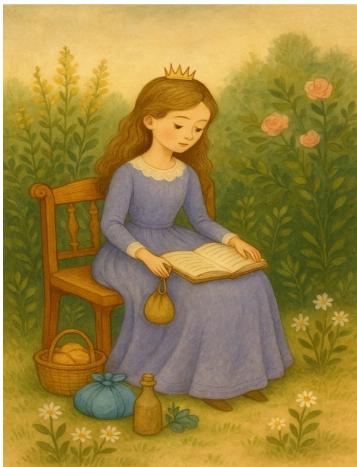
slika Modesta, urejena, mirna, v stalnem ravnovesju

Modesta je tudi očeta pogosto karala, ker je prirejal prebogate zabave, ona pa bi raje denar preusmerila tistim, ki so ga imeli premalo. Kdor ni vedel, kaj je zmernost, je obiskal Modesto.