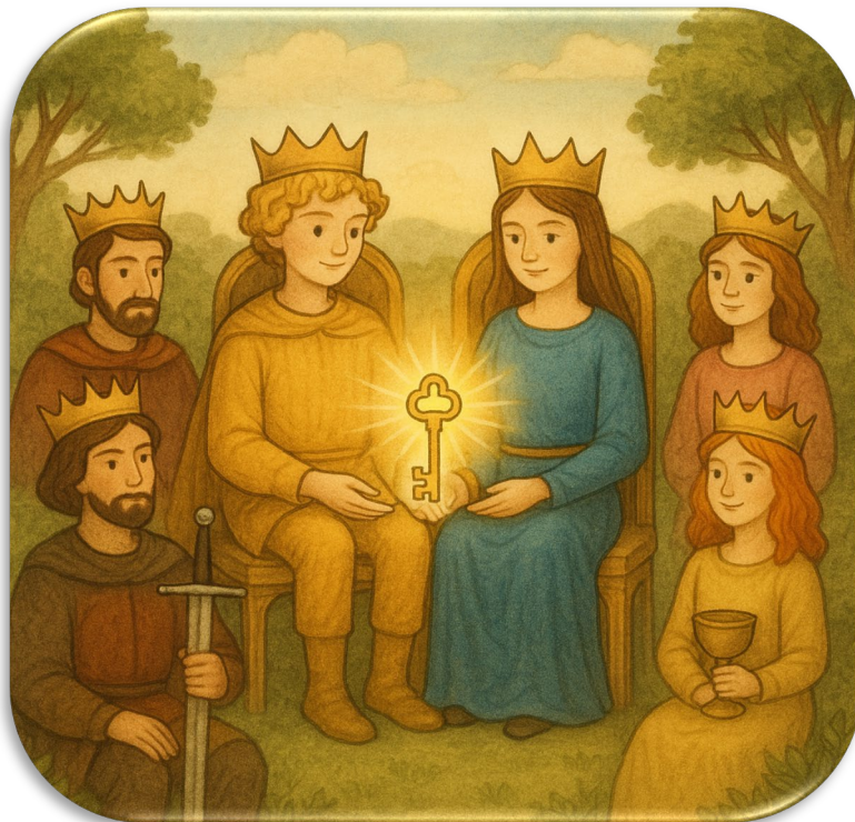
slika Sofija in Golden Rule z zlatim ključkom oaznih kod

V tistem trenutku se je zaslišalo šumenje vetra – in v daljavi so se prižgale prve Oaze miru.