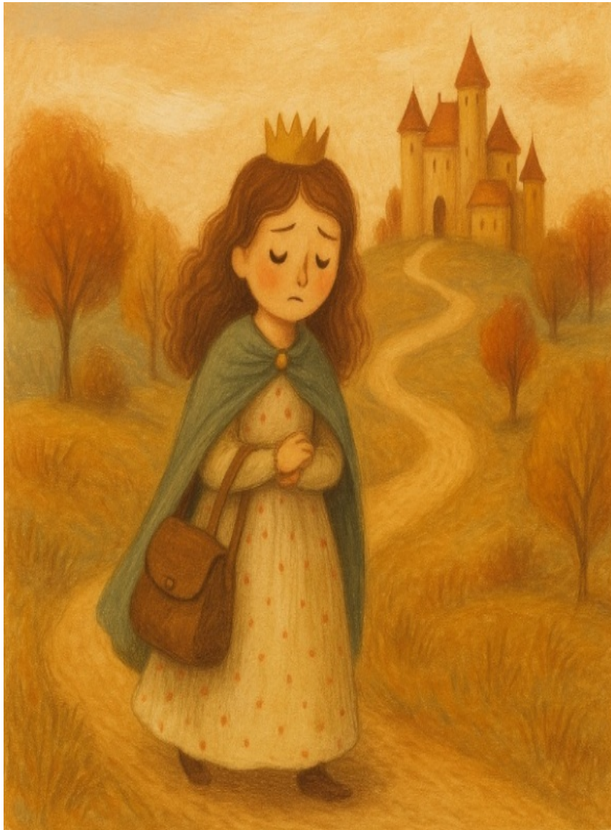
slika Modesta, mirna in mehko razumevajoča